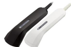
OPR-2001V レーザースキャナー