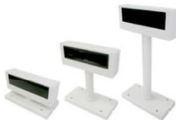
カスタマディスプレイ LD220