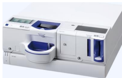
グローリー製自動釣銭機 RT300/RAD300