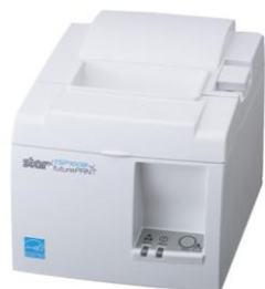
TSP143 レシートプリンタ