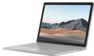
PcPOS本体 (Windows 10 model)